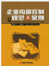
企业内部控制与案例