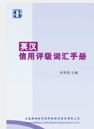
英汉信用评级词汇手册