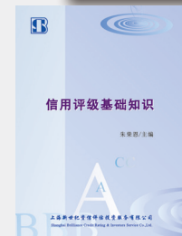
信用评级基础知识